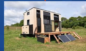
lien maison low-tech

Le deuxième objectif est de répondre aux besoins de l'être humain .Un vrai défi avec du low-tech !!