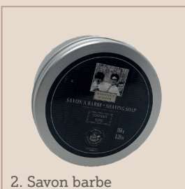
2. Savon barbe