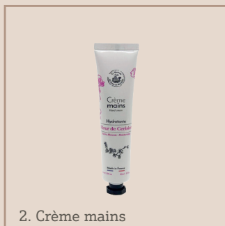
2. Crème mains