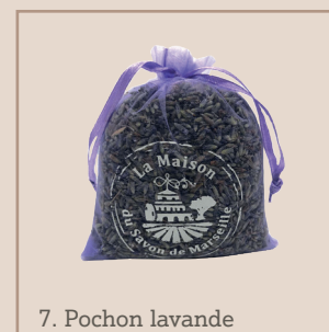
7. Pochon lavande