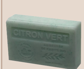
6. Citron Vert