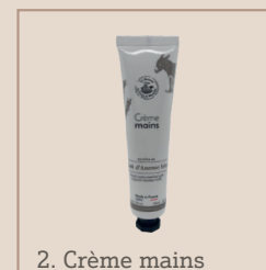
2. Crème mains