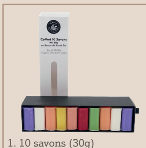
1. 10 savons (30g)