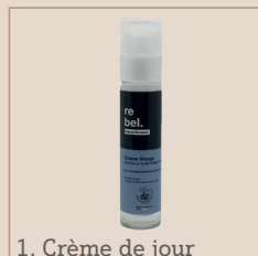
1. Crème de jour