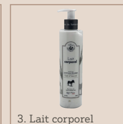
3. Lait corporel