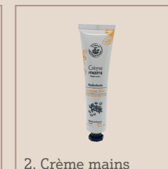
2. Crème mains