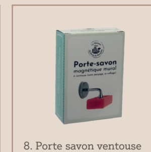
8. Porte savon ventouse