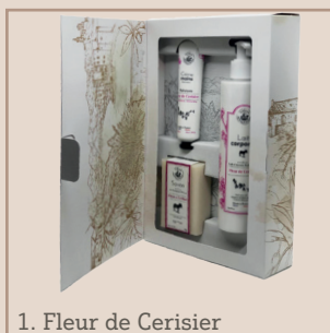
1. Fleur de Cerisier