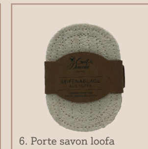
6. Porte savon loofa