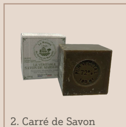
2. Carré de Savon