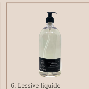
6. Lessive liquide