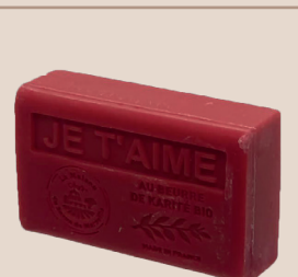
3. Je t'aime*