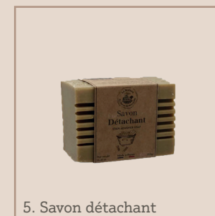
5. Savon détachant