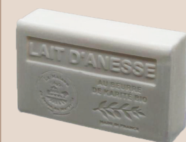
10. Lait d'ânesse