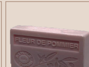
6. Fleur de Pommier