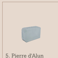
5. Pierre d'Alun