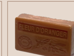
5. Fleur d'Oranger