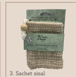
3. Sachet sisal