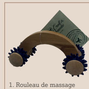
1. Rouleau de massage