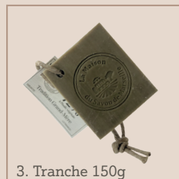
3. Tranche 150g