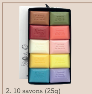
2. 10 savons (25g)