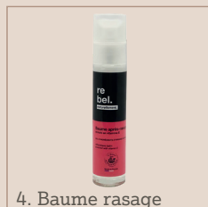
4. Baume rasage