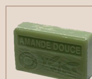
3. Amande Douce