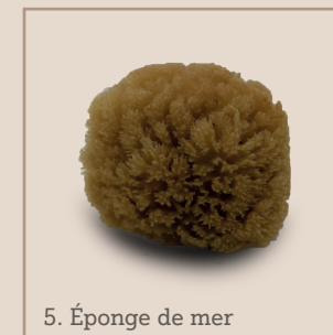
5. Éponge de mer