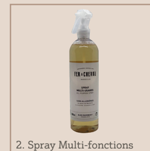
2. Spray Multi-fonctions