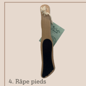
4. Râpe pieds