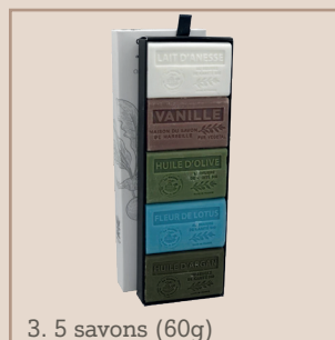
3. 5 savons (60g)