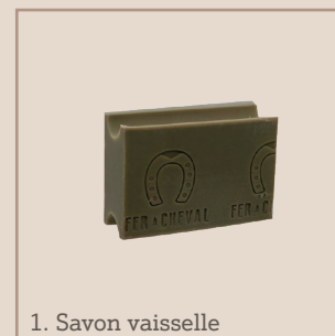
1. Savon vaisselle