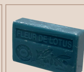
2. Fleur de Lotus