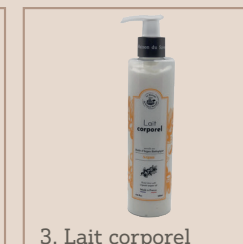
3. Lait corporel