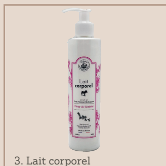
3. Lait corporel