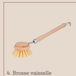
4. Brosse vaisselle