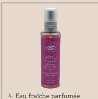
4. Eau fraîche parfumée