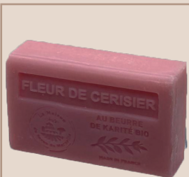
2. Fleur de Cerisier