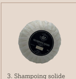
3. Shampoing solide