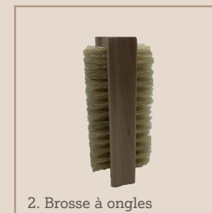
2. Brosse à ongles