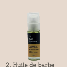
2. Huile de barbe