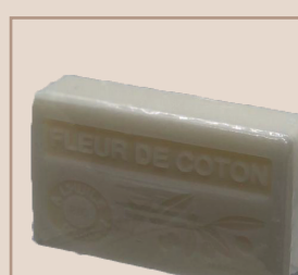
1. Fleur de Coton

Savon à l'huile d'argan, mousse légère, assouplissant, hydratant et favorise la régénération cellulaire.