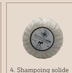
4. Shampoing solide