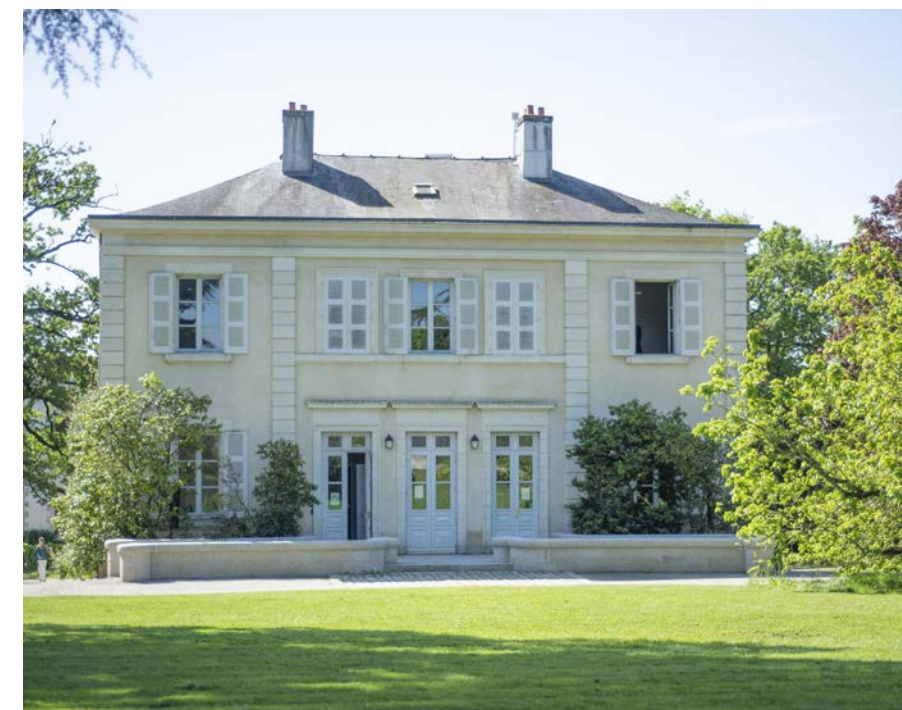
Maison du directeur

Les Haras «royaux», puis «nationaux», existent depuis le 17 e siècle, lorsque Colbert, ministre de Louis XIV décide de leur création en 1665. À l'époque, et pendant plusieurs siècles, le cheval est en effet nécessaire dans de nombreux domaines, et notamment d'un point de vue militaire : il est le seul moyen de locomotion «rapide» avant que n'apparaissent l'automobile, l'aviation, les chars... Il est donc décidé de créer des lieux spécifiques pour gérer leur reproduction et améliorer la race équine... pour fournir les armées.