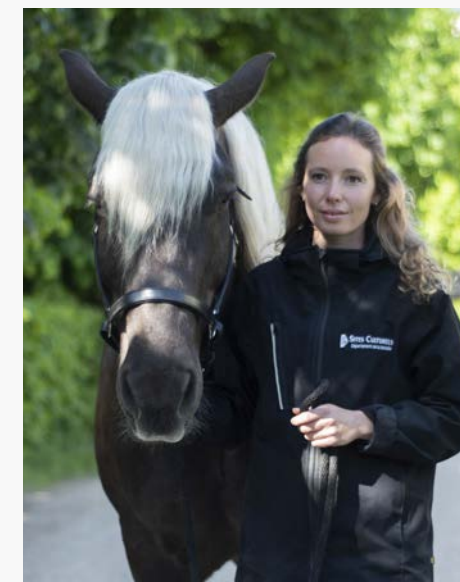
Romane et Babar

Sont présents également les médiateurs de l'École des Arts et du Patrimoine du département de la Vendée. Au service des écoles, collèges et lycées, leur rôle est de transmettre la mémoire du lieu, et les savoir-faire liés aux métiers du cheval auprès des plus jeunes.