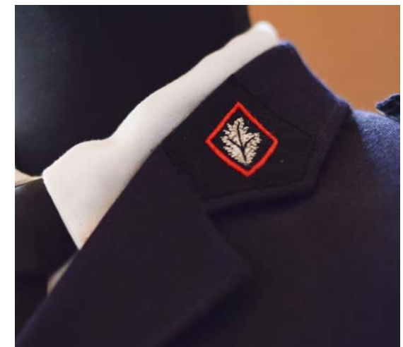
Détail d'un uniforme

Entre les écuries n°1 et 2, se trouve la sellerie d'honneur. Cet espace à part, existant depuis 1846, expose les harnachements de prestige fabriqués sur place par les bourreliers selliers au fil des années. À l'époque ces harnais servaient tous les jours pour travailler les chevaux. Aujourd'hui ils sont utilisés lors des cérémonies officielles. On y découvre, par exemple, la selle américaine utile aux cow-boys, la selle napoléonienne servant la cavalerie au XIX e siècle, ou encore la selle des gauchos utilisée en Amérique du Sud par les gardiens de moutons dans la pampa. On peut observer également une série de harnais destinés à l'attelage. Enfin, au centre de la pièce, on découvre avec surprise le squelette de Brocardo, un étalon pur-sang anglais du XIX e siècle.