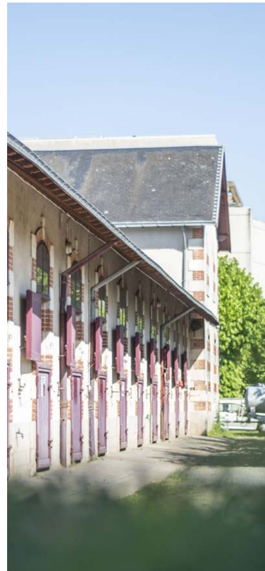
Écuries, Haras de la Vendée

La couleur bordeaux des fenêtres correspond à celle des Haras nationaux. On y retrouve les bâtiments propres à ceux d'un Haras : maison de directeur, maison de sous-directeur, écuries, carrière... le tout au milieu d'un parc arboré et fleuri.